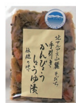
かんぴょうしょうゆ漬け