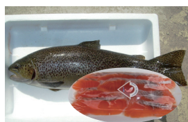
信州サーモン (申請中)