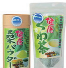
桑パウダー・桑茶