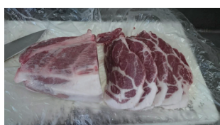
信州吟醸豚 (申請中)