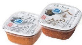
金の鈴味噌・銀の鈴味噌